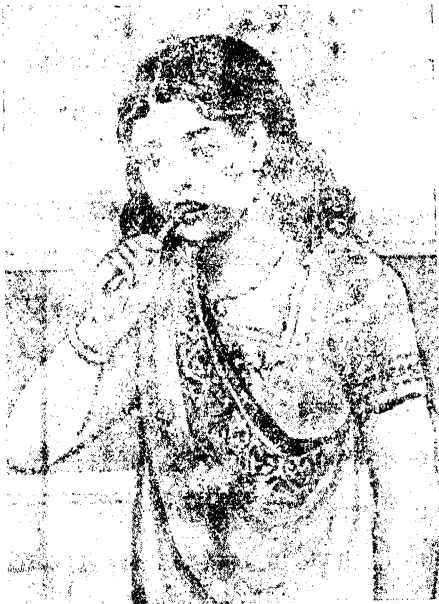
चित्र ५—दातौन करना

दाँतों से अच्छी तरह चबा चबा कर खाना खाना चाहिए। अच्छी तरह चबा कर भोजन करने से वह हजम जल्द होता है और आमाशय को अधिक काम नहीं करना पड़ता। अनेक वैद्य और